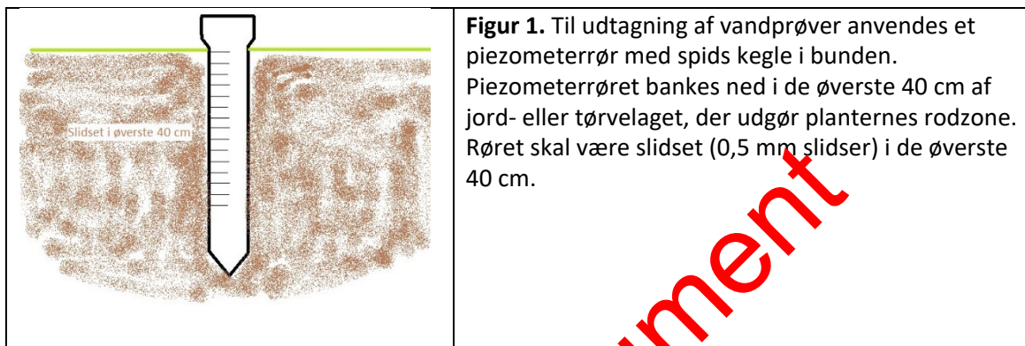
Figur 1. Til udtagning af vandprøver anvendes et piezometerrør med spids kegle i bunden. Piezometerrøret bankes ned i de øverste 40 cm af jord- eller tørvelaget, der udgør planternes rodzone. Røret skal være slidset (0,5 mm slidser) i de øverste 40 cm.

Til udtagning af vandprøver til feltmåling af pH anvendes et piezometerrør, der bankes ned i planternes rodzone (de øverste 40 cm af jord- eller tørvelaget). Røret skal være slidset i øverste 40 cm (se Figur 1). Piezometerrøret kan med fordel monteres med en spids kegle i bunden, så det er nemmere at banke det ned gennem jord- eller tørvelaget. På nogle lokaliteter kan det være nødvendigt at anvende et jordbor. Vandprøverne suges op af røret ved hjælp af en slange påmonteret en pumpe eller en 100 ml engangssprøjte og hældes op i en beholder.