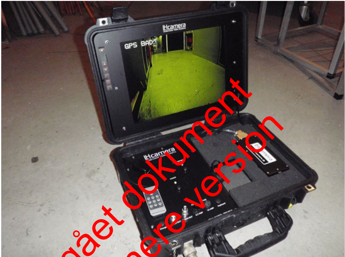
Figur 2 Videosystemets overflade del indeholder: Kontrolpanel til undervandskamera, GPS, video-overlay til GPS og brugertekst, digital videooptager og datalogger, samt markørterminal.

Videosystemet består af en kuffert med indbygget skærm, digital videooptager, GPS og en markør-terminal samt en datalogger, der løbende opsamler GPS-data koblet med markøraktiveringer. Markørterminalen anvendes primært til markeringer af vegetationens maksimale dybdegrænse, samt ålegræssets hovedudbredelse (overgang til >10 % dækning) (figur 2).