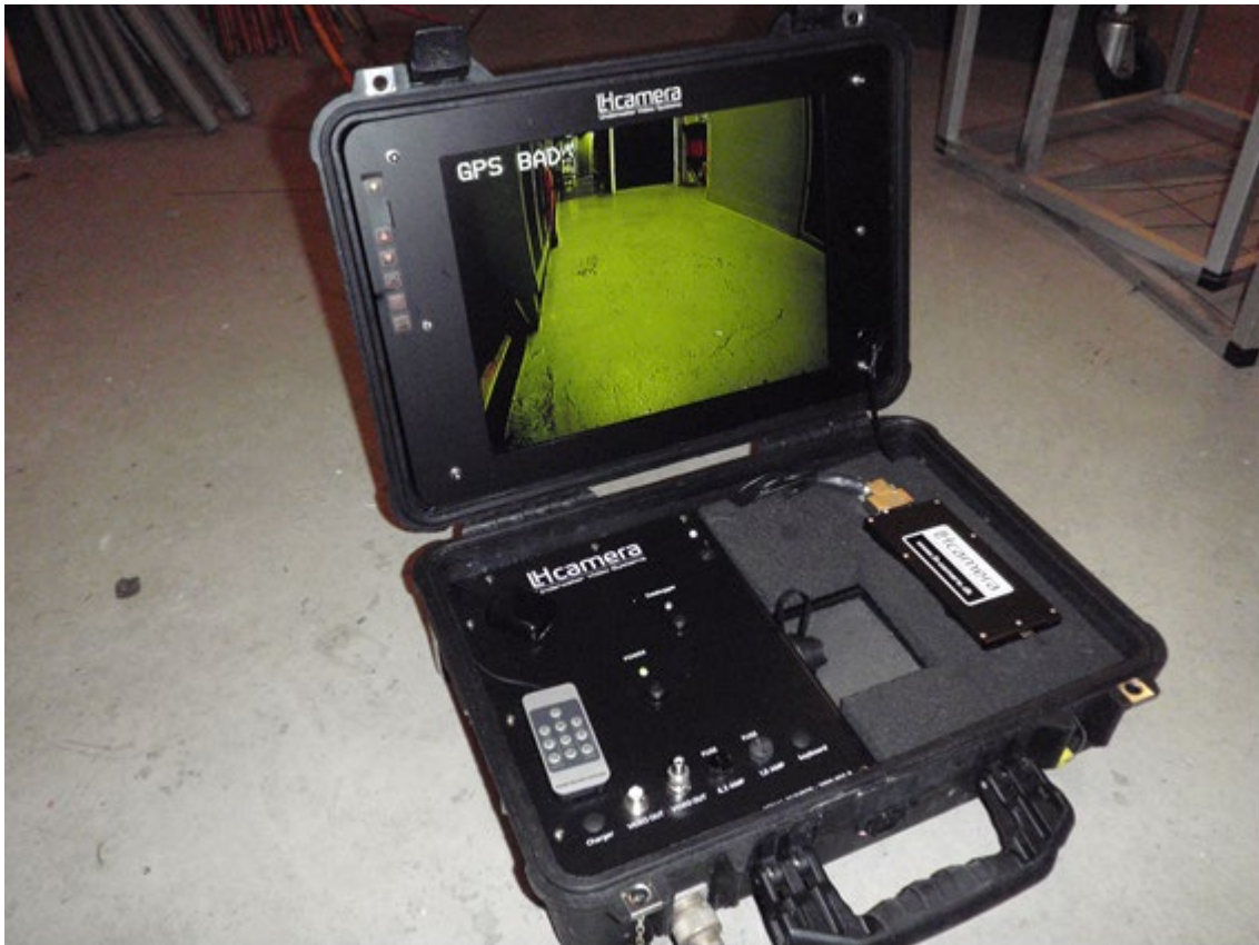
Figur 2 Eksempel på videosystemet til ålegræsundersøgelser. Overfladedelen indeholder: Kontrolpanel til undervandskamera, GPS, video-overlay til GPS og brugertekst, digital videooptager og datalogger, samt markørterminal.

Videosystemet består af en kuffert med indbygget skærm, digital videooptager, GPS og en markør-terminal samt en datalogger, der løbende opsamler GPS-data koblet med markøraktiveringer. Markørterminalen anvendes primært til markeringer af vegetationens maksimale dybdegrænse, samt ålegræssets hovedudbredelse (overgang til >10 % dækning) (figur 2).