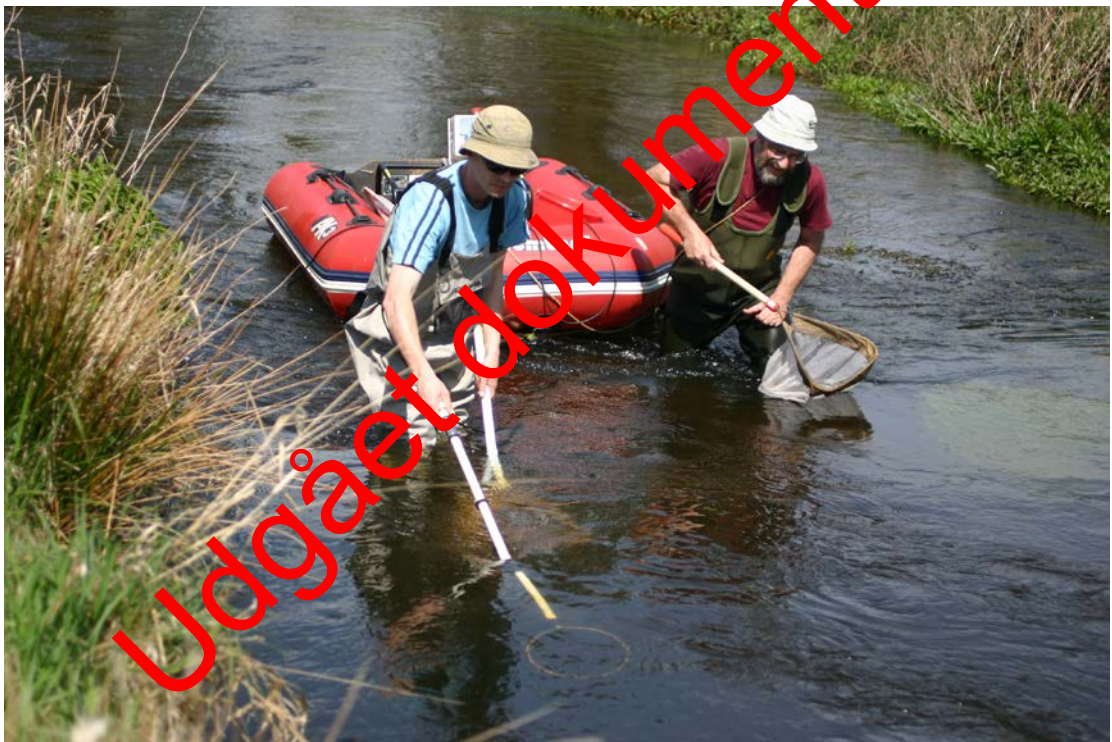
Figur 3. Generator, ensretterboks og baljer er placeret i gummibåd, som trækkes af medhjælperen. Dette minimerer tidsforbruget ved håndtering af de fangne fisk, ligesom man undgår problemer med at kablet sætter sig fast..

ter sig. De fangne fisk placeres hurtigst muligt i baljer med vand, hvori der med fordel kan placeres en mindre spand til at skabe skjul. Ål holdes adskilt fra andre arter, da disse ikke tåler ålens slim i deres gæller. Store og små fisk holdes desuden så vidt muligt adskilt, fordi små fisk (specielt laksefisk) kan blive stressede af at opholde sig sammen med store fisk.