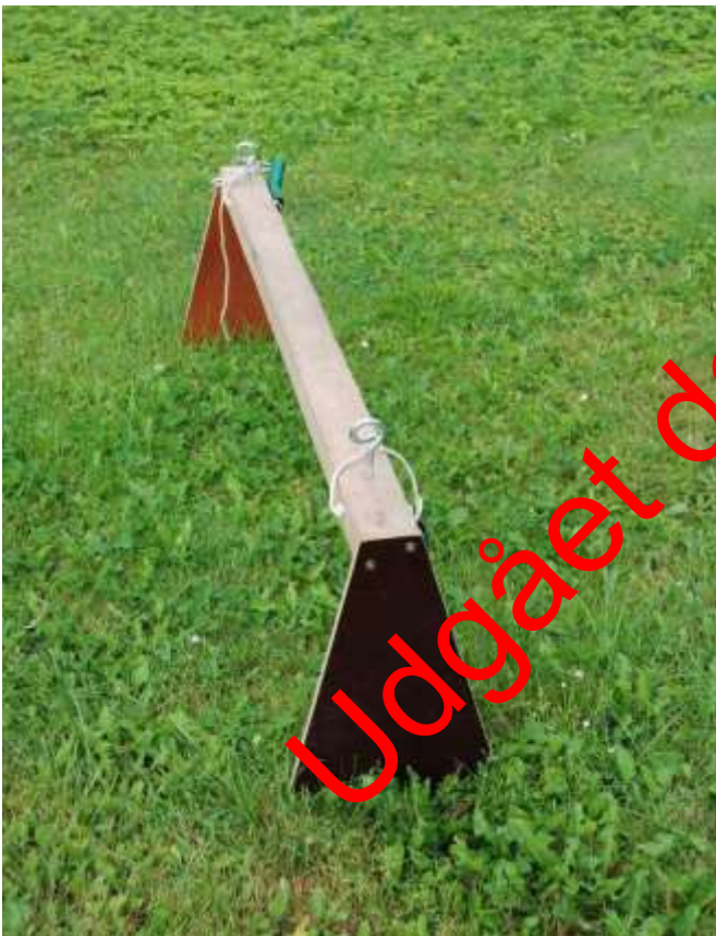
Figur 2. Bom til fastgørelse af tov/wire ved brug af gummibåd i ikke-vadbare vandløb. Bommen placeres på tværs af gummibåden – umiddelbart bag sædet. Bommen skal være så bred, at den lige akkurat kan "klemmes" ned over ydersiden af båden. Bommen fastgøres ved hjælp af nylonstrømpe til båden, på siderne placerede bærehåndtag. Tov/wire føres igennem de to metalkroge. Det gør fastgørelse og frigørelse af tov let.

Succesen af overvågningsindsatsen afhænger af, om det er muligt at se bunden. Der skal derfor, så vidt muligt, vælges tidspunkter til undersøgelserne, hvor vandet er klart, og vanddybden ikke er uforholdsmæssigt høj (efter kraftige regnhændelser og lignende).