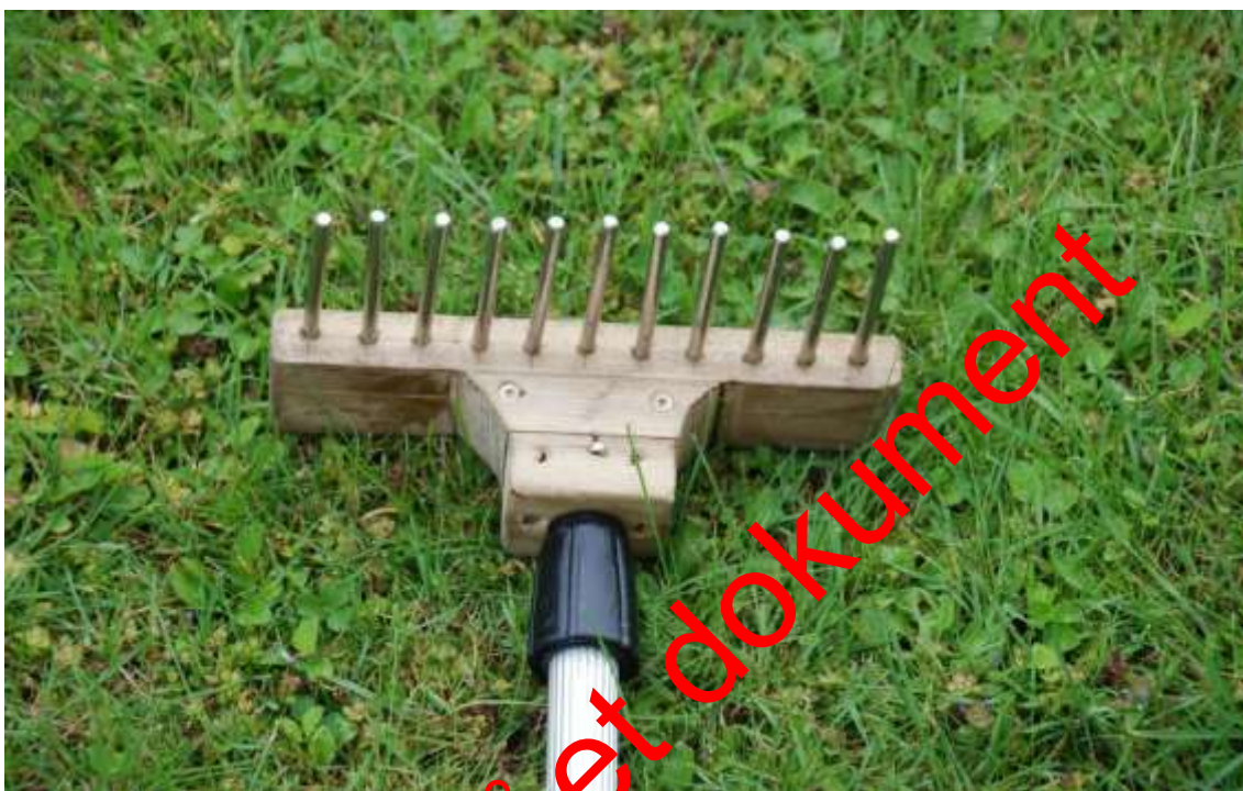
Figur 3. Eksempel på planterive monteret på teleskopstang særlig velegnet til brug ved registrering af planter, substrat og dybde fra båd – hvor vandet er uklart eller for dybt til brug af vandkikkert. Rivehovedet har følgende dimensioner: Bredde – 200 mm, tændernes længde – 80 mm, tykkelse – 6 mm, afstand mellem tænder – ca. 13 mm.

Registrering af supplerende plantearter og skøn af den samlede dækningsgrad foretages inden for de 5 rektangler, som afgrænses af de 6 faste transekter. Der anvendes "Sigurd Olsen-rive", der kastes ca. 5 m nedstrøms i forhold til båden 10-15 steder (10 hvis vandløbet er < 20 m bredt, 15 hvis det er \geq 20 m bredt) jævnt fordelt på tværs af vandløbet. Dette foretages mest hensigtsmæssigt, når båden fires tilbage til udgangspunkt langs et givent transekt, inden den flyttes til det næste transekt. Den samlede dækningsgrad udregnes som gennemsnittet af de skønnede dækningsgrader for hvert af de 5 transekt-mellemrum.