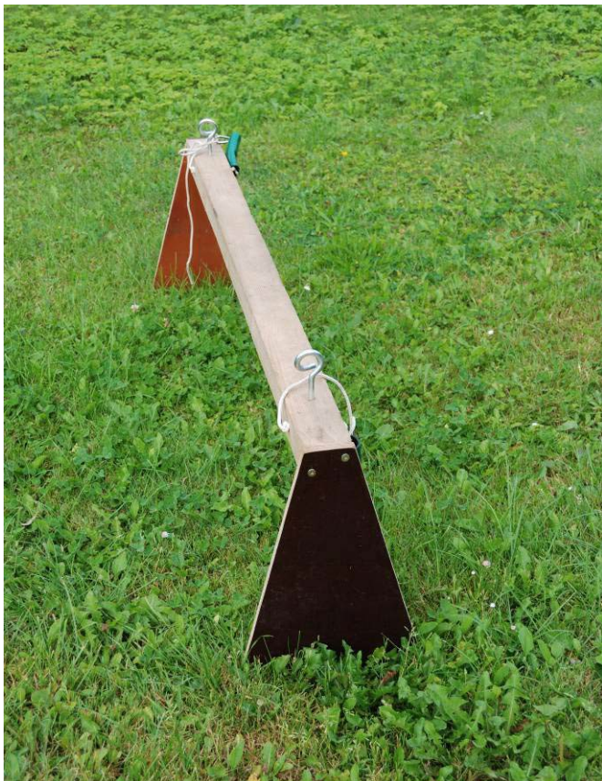
Figur 2. Bom til fastgørelse af tov/wire ved brug af gummibåd i ikke-vadbare vandløb. Bommen placeres på tværs af gummibåden – umiddelbart bag sædet. Bommen skal være så bred, at den lige akkurat kan "klemmes" ned over ydersiden af båden. Bommen fastgøres ved hjælp af nylonstrømpe til bådens på siderne placerede bærehåndtag. Tov/wire føres igennem de to metalringe. Det gør fastgørelse og frigørelse af tov let.

Er dybden for stor – eller vandet for uklart – til at der kan anvendes vandkikkert ved registreringen, skønnes plantedækningen i kvadraterne ved brug af 20 cm bred rive monteret på en passende lang stang (teleskop), se figur 3 samt supplerende figurtekst 1. Riven trækkes et par gange gennem hvert kvadrat – og de fasthæftede planter undersøges. Pas på, at planterne ikke skylles af, når riven tages op. Substratsammensætningen skønnes tilsvarende ved at støde riven mod bunden; det vil således være muligt at skelne mellem sandet, gruset eller stenet bund. Forekomst af sten eller groft grus erkendes også, hvis der hænger sten/grus i riven, når den tages op. Dybder kan desuden med fordel måles med planteriven (efter passende afmærkning i 10 cm intervaller på skaftet; tag højde for teleskopet, fx ved at afmærke 0,5 og 1,0 m på den del, som trækkes ud).