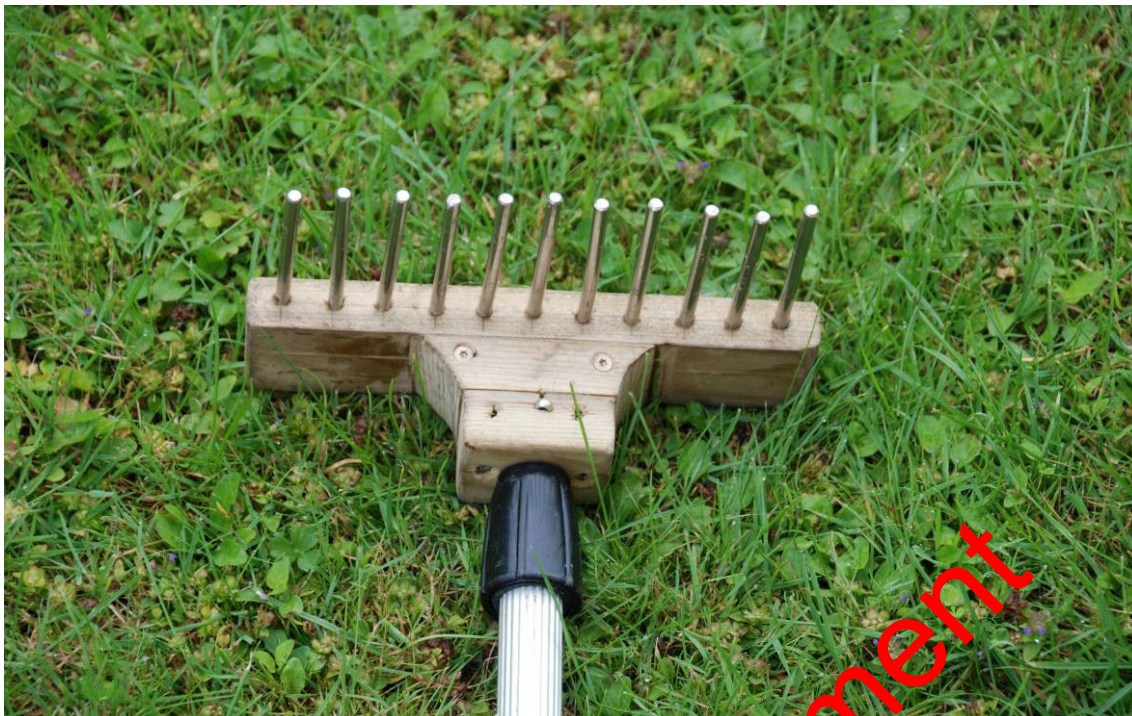
Figur 3. Eksempel på planterive monteret på teleskopstang særlig velegnet til brug ved registrering af planter, substrat og dybde fra båd – hvor vandet er uklart eller for dybt til brug af vandkikkert. Rivenovedet har følgende dimensioner: Bredde – 200 mm, tændernes længde – 80 mm, tykkelse – 6 mm, afstand mellem tænder – ca. 13 mm.