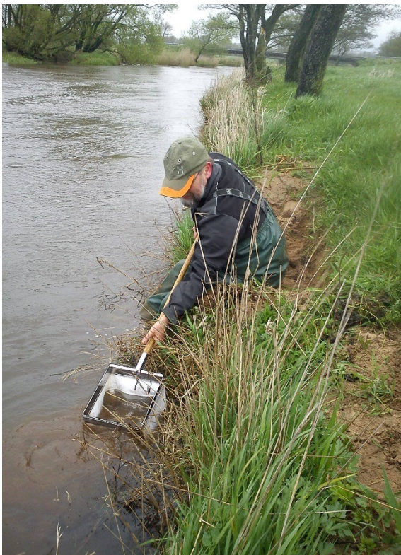
Figur 2. Prøvetagning med "lampret-ketsjer" langs bredden af Skjernå. Netprøven er taget helt tæt på bredden, og indholdet skylles ved at bevæge netposen frem og tilbage gentagne gange. I skylleresten (se nedenfor) gemmer lampretlarverne sig. (Fotos: Thorsten Møller Olesen).

B. På lokaliteter i mindre vandløb, hvor kun bæklampret forventes at forekomme (bilag 6.2c): Der fiskes indtil fangst af første individ – dog højst i 20 minutter. Der foretages ikke måling af længden af de fangne individer.