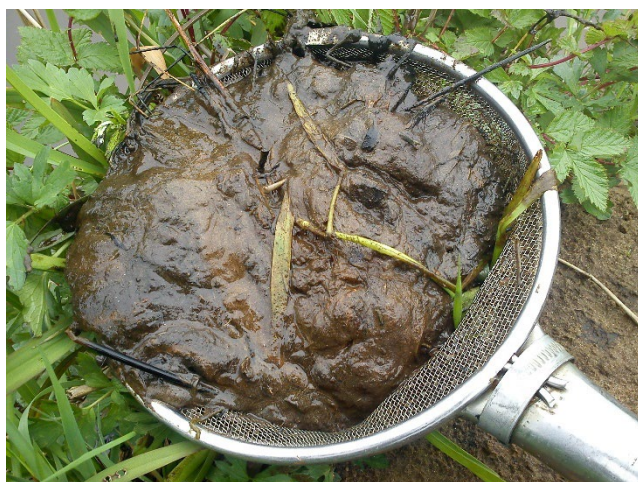
Således ser det overfladenære substrat ud, når det er et optimalt levested for lampretternes larver.

Lampretterne er ikke "rigtige" fisk, men tilhører rundmundene. Alle vore tre arter gyder i vandløb, typisk på stenet/gruset bund. Her laver hannerne en primitiv rede eller gydegrube i bunden ved at "møblere" om på grus og sten. I reden/gruben gydes æg og sæd – ofte på solrige dage. Efter gydningen dør de voksne. Fra æggene klækkes larver, som tilbringer op til flere år nedgravet i finkornet sediment, som er rigt på organisk stof – dvs. mudret til siltet bund – men som er iltet ned til ca. 10 cm. I den sidste del af opholdet i bunden og efter at have forladt denne forvandles larverne gradvist til voksne individer. Der er herefter forskel i arternes livscyklus.