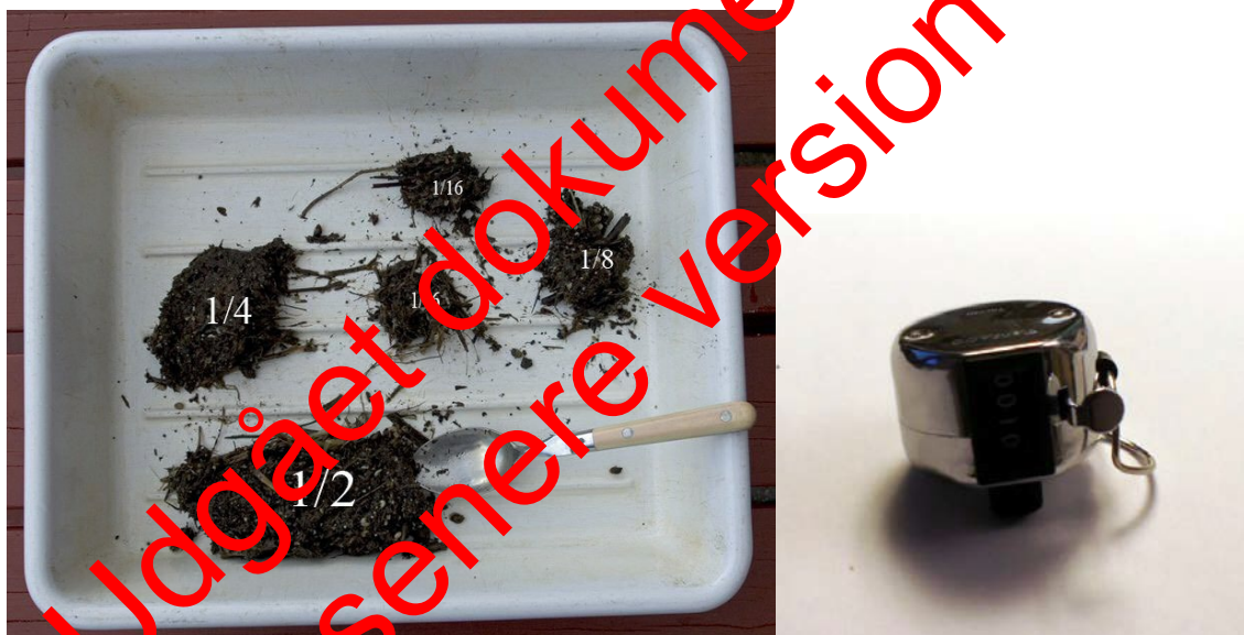
Figur 4. Subsampling (opdeling) af den skyllede og drænedede prøve. Det kan enten gøres i sigten eller som her i en bakke. Herefter kan de mindre dele af den samlede prøve sorteres. Desuden vist tælleur til optælling af individer.

Skyl indledningsvis prøven grundigt med vand i en sigte (maskevidde 500 µm). Har prøven været konserveret med ethanol, vil mange dyr flyde på overfladen, når prøven placeres i en bakke med vand. Det er derved let at se, hvilke taxa der med fordel kan subsamples. Hæld så prøven tilbage i sigten og dræn vandet fra. Sørg for at materialet er jævnt fordelt i sigten. Udtag passende portioner (1/2, 1/4, 1/8, 1/16, 1/32) til subsampling af de talrige taxa – jf. figur 4.