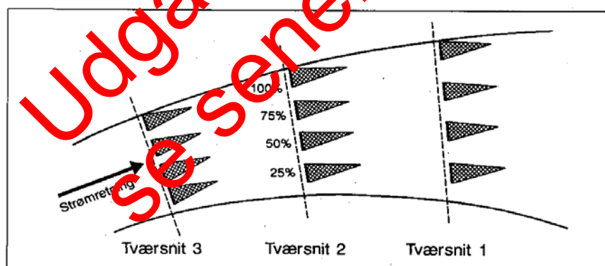
Figur 1. Udtagning af sparkeprøve i vandløb bredere end ca. 1 m. Tværsnittene (transekterne) er nummeret i den rækkefølge de skal tages.

Når vandet igen er klart, hvor det blev sparket, sparkes én gang mere. Når vandet igen er klaret op, løftes ketsjeren op mod strømmen, så materialet samles i bunden af ketsjerposen (eller beholderen). Det er vigtigt, at tryk og kraft i sparket afpasses til substratet: på sten-/grusbund skal der sparkes hårdt, mens der på sand og blød organisk bund sparkes meget let. Dermed sikres en passende stor prøvemængde: tilstrækkelig mange dyr og ikke uforholdsmæssigt meget bundmateriale.