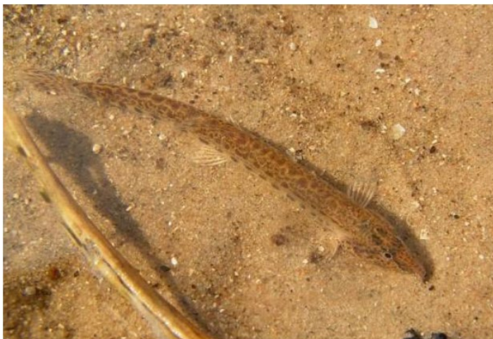
Pigsmerling på sandbund.