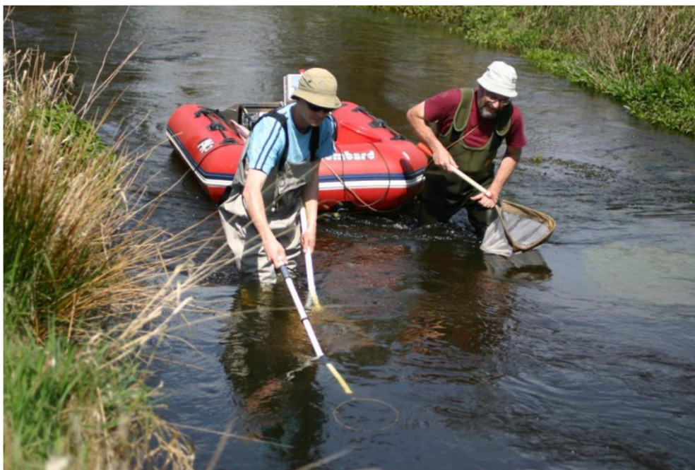
Figur 2. Generator og ensretterboks og baljer er placeret i gummibåd, som trækkes af medhjælperen. Dette minimerer tidsforbruget ved håndtering af de fangne fisk, ligesom man undgår problemer med at kablet sætter sig fast.

Det enkelte prøvefelt befiskes én gang inden for et maksimalt tidsrum af 15 minutters effektiv fisketid (dvs. hvor elektroden er i vandet). Der fiskes dog kun indtil fangst af den første pigsmerring, hvorefter fiskeriet standses. Tidsrummet indtil første fangst noteres. Fanges ingen pigsmerring, noteres dette.