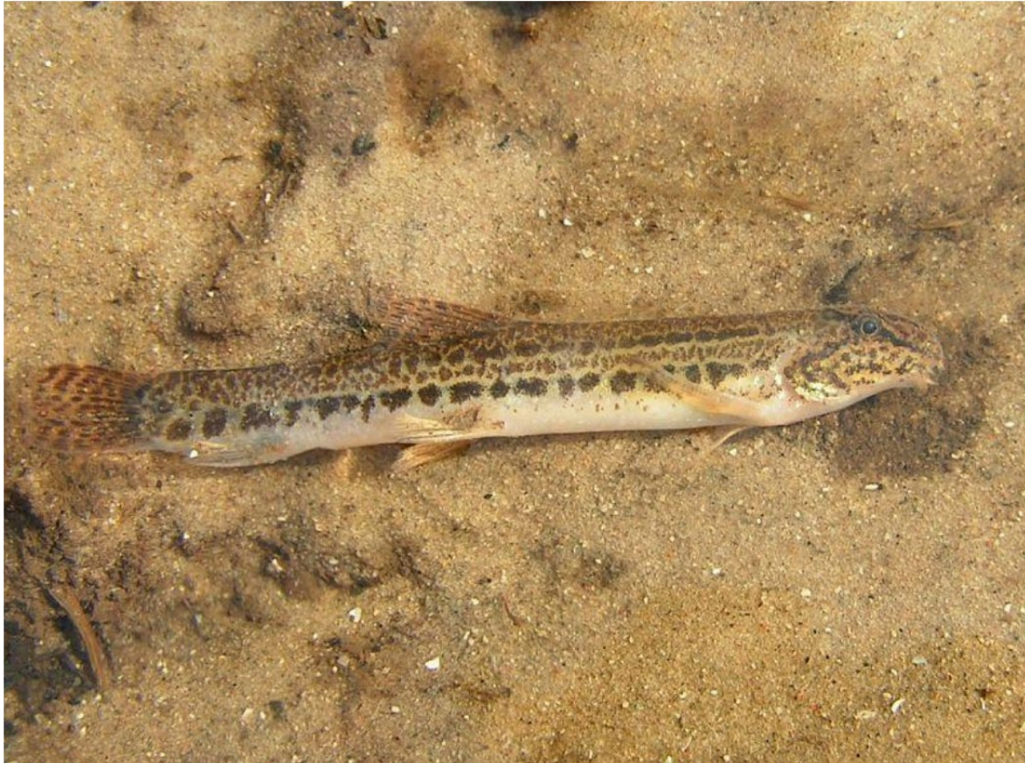
Figur 3. Pigsmerling.

Pigsmerling bør være let at identificere (figur 3). Eneste reelle forvekslingsmulighed er med små individer af smerling og dyndsmerling.