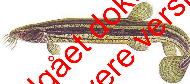
Figur 3. Dyndsmerling ( http://atlas-ryb.rybarskeforum.cz/anglicky-nazev/42-weather-fish ).