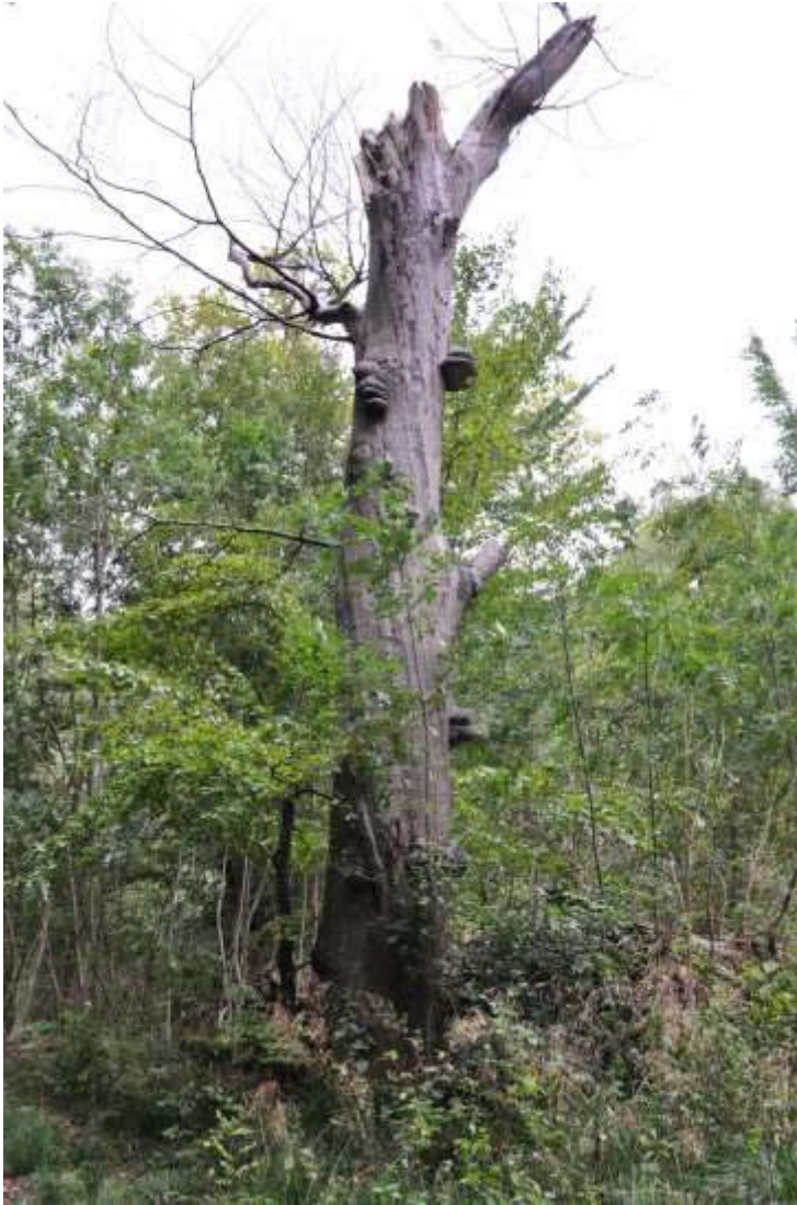
Foto 5. Bøg. Nuværende egnet værtstræ, som ikke er et egnet værtstræ om 25 år.