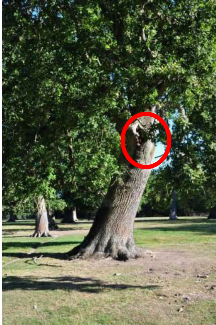
Foto 1. Eg. Nuværende egnet værtstræ med hulhed (rød cirkel, se foto 2), som er helt lysstillet og er egnet værtstræ om 25 år.