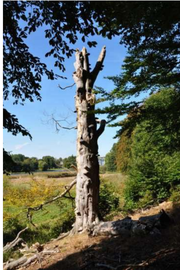
Foto 6. Bøg. Nuværende egnet værtstræ, som ikke er et egnet værtstræ om 25 år.