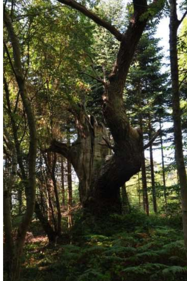
Foto 4. Eg. Nuværende egnet værtstræ, som er ringe lysstillet og ikke er et egnet værtstræ om 25 år (Foto: Palle Jørum).