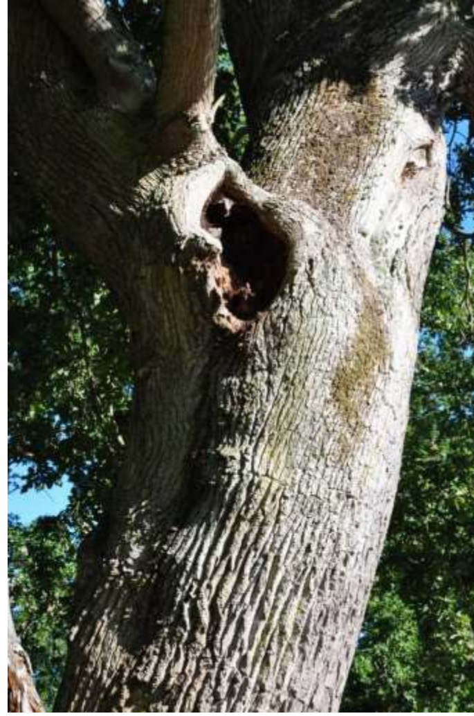
Foto 2. Samme eg som på foto 1 med fokus på hulhed i den røde cirkel.