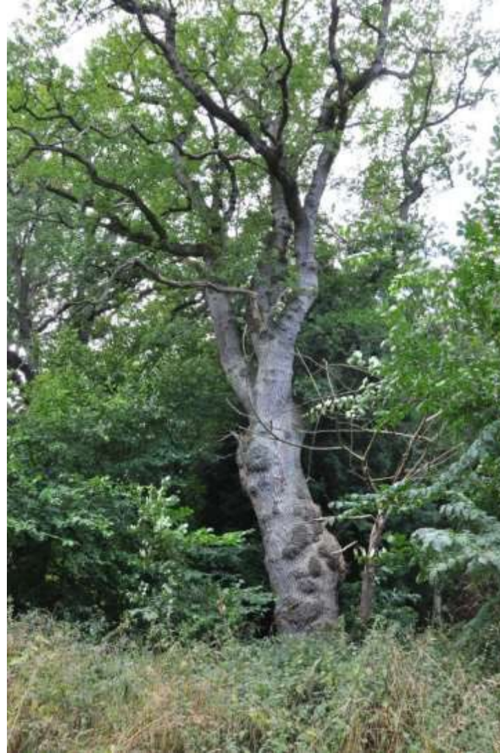
Foto 8. Eg. Erstatningstræ, som vil kunne udvikle sig til et egnet værtstræ henover en periode på 25 år (Foto: Palle Jørum).