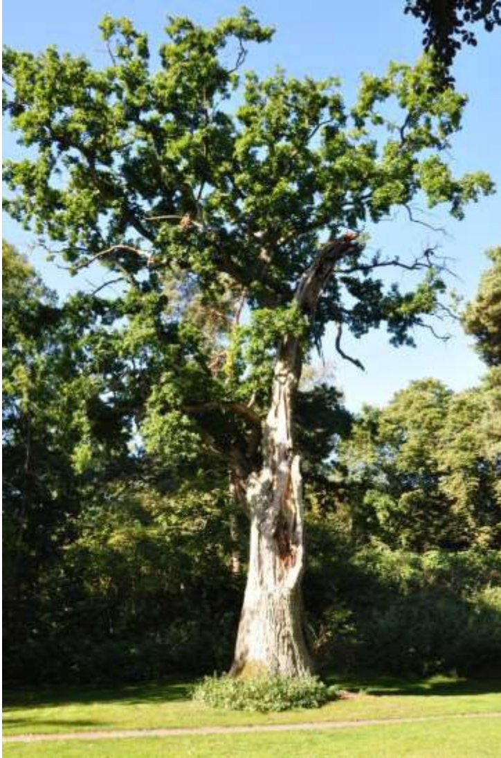
Foto 3. Eg. Nuværende egnet værtstræ, som er delvist lysstillet og er et egnet værtstræ om 25 år.