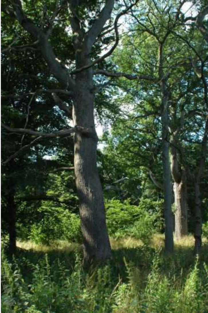
Foto 7. Eg. Erstatningstræ, som vil kunne udvikle sig til et egnet værtstræ henover en periode på 25 år.