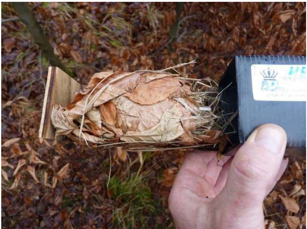
Figur 7. "Klassisk" redetype med bøgeblade og kerne af bl.a. græs.