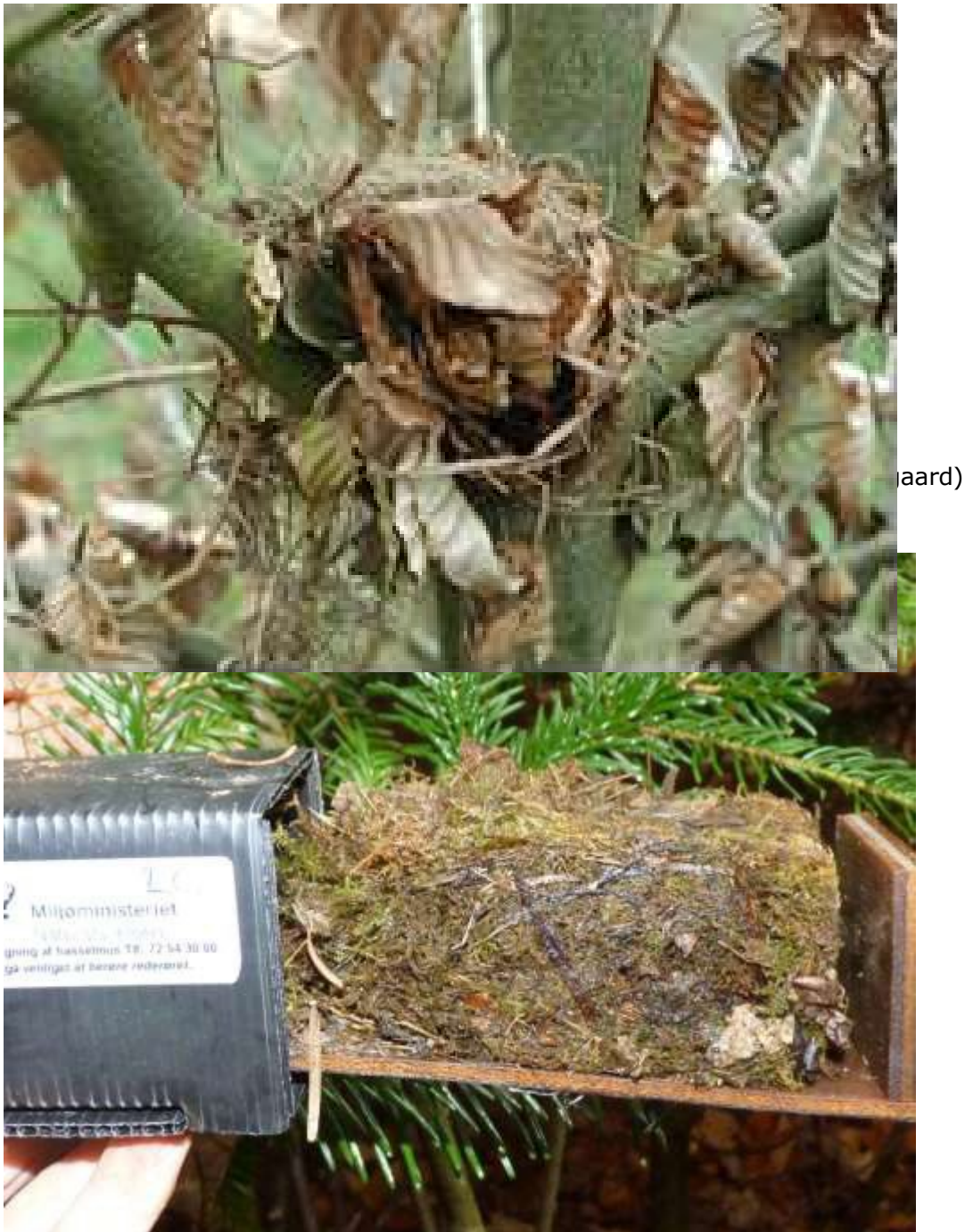
Figur 5. Redetype med meget mos. Bemærk at rederøret er opsat i ædelgran