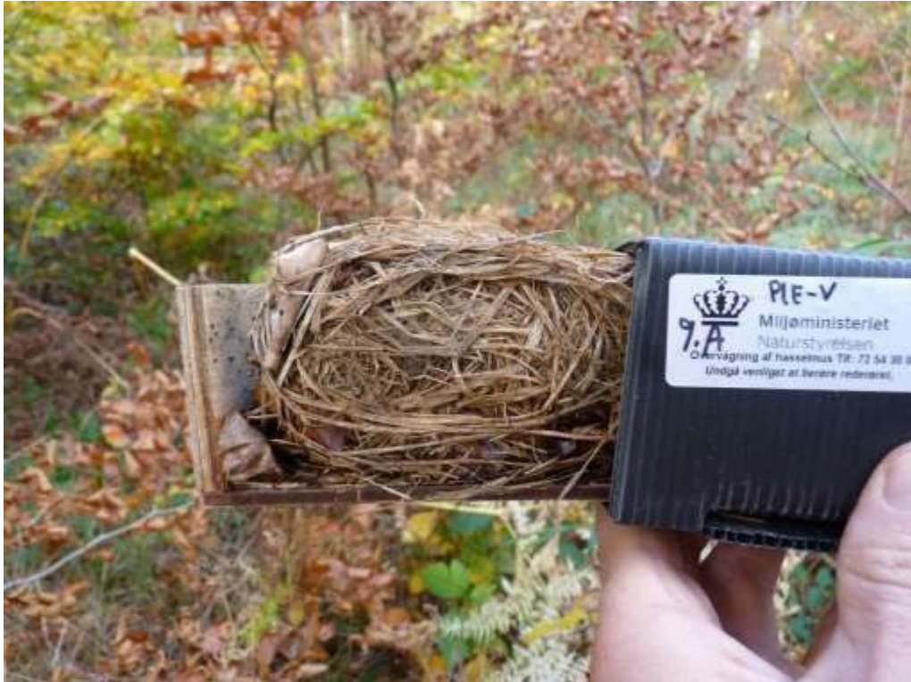
Figur 6: Redetype med meget græs