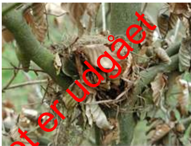
Figur 3. Rede af hasselmus i ungkultur af bøg

Der udfyldes særskilt skema for begge besøg (bilag 6.1).