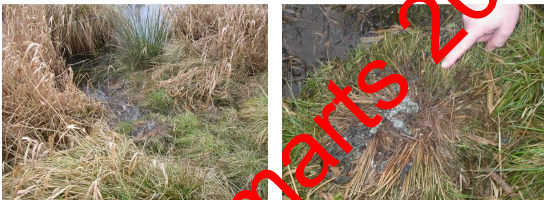
Figur 2. Odderveksel ved vandløb med friske ekskrementer af odder. Til højre nærfoto af ekskrementerne

På hjælpeskemaet (Bilag 6.1) anføres antallet og alder (friske/gamle) af ekskrementer - samt længden af den undersøgte strækning og tidsforbruget.