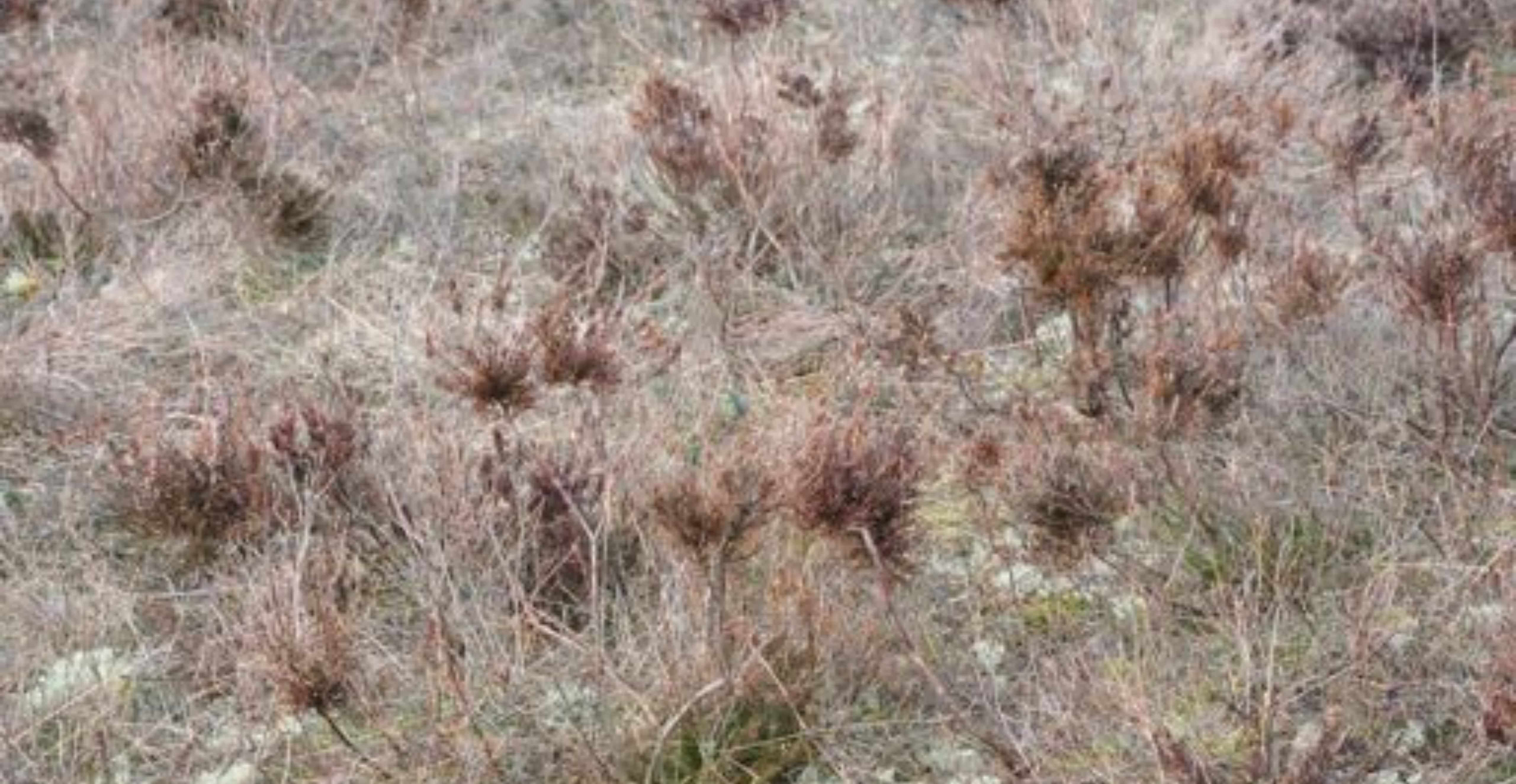
Gjenvekst af hedelyng efter 2. gangs maskinell slått.