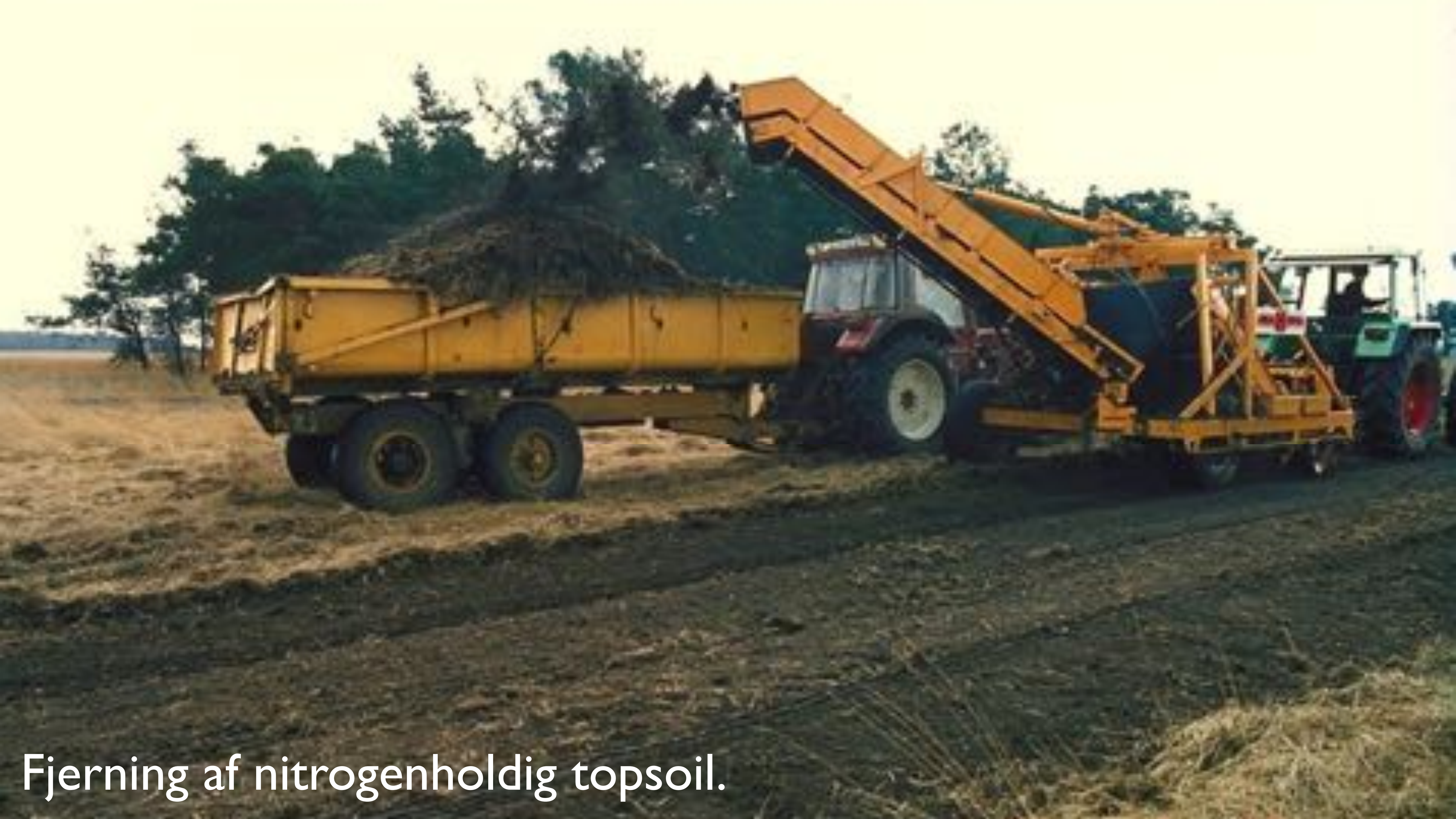
Fjerning af nitrogenholdig topsoil.