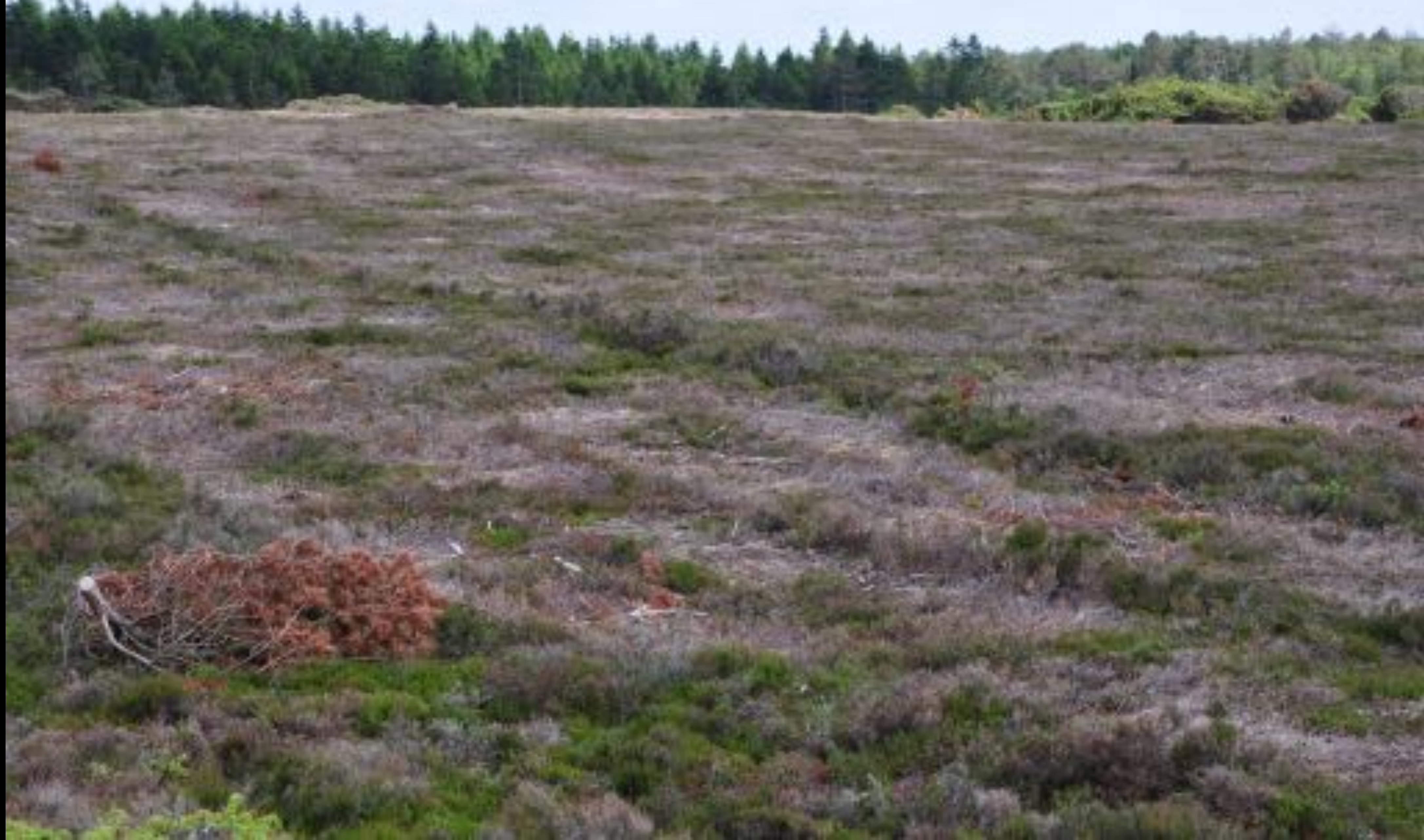
Moderne maskinell hedeslått, Vestjylland.